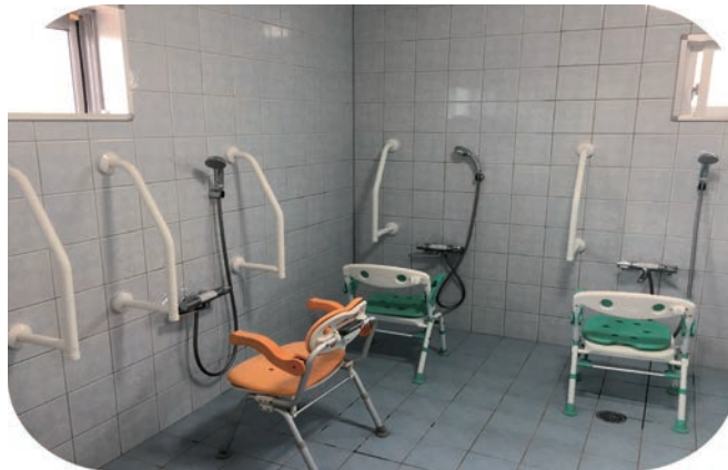
△疲れを癒やす入浴