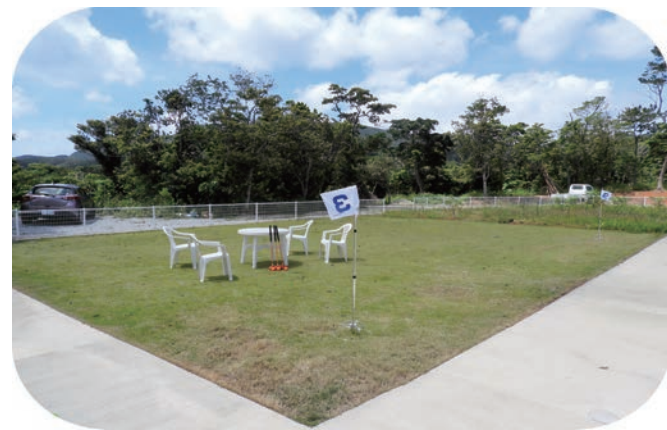
△菜園&芝生広場と遊歩道（一周 170m）