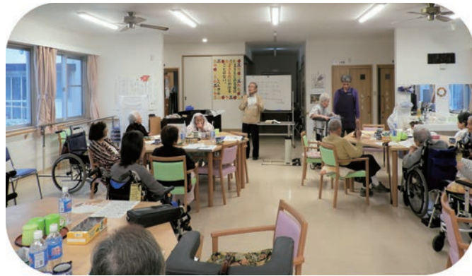
△家庭的な雰囲気できつろげる室内